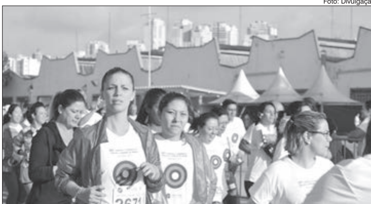
Corrida e caminhada em prol da campanha contra o câncer de mama

No dia 30 de setembro, a partir das 7 horas, no Campo de Marte, o IBCC (Instituto Brasileiro de Controle do Câncer) realiza a 57ª edição da Corrida e Caminhada contra o Câncer de Mama.