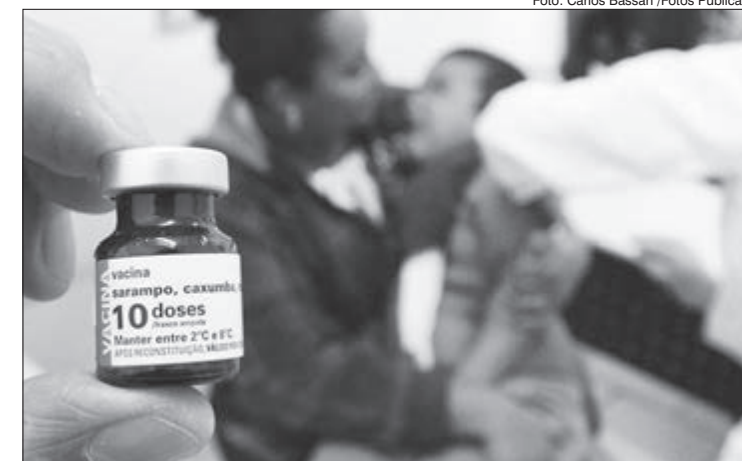
Campanha de vacinação contra Sarampo no País

Nesse ano de 2018, já foram confirmados 1.054 casos de Sarampo em todo o País, houve um aumento de 232 casos desde o dia 17 de julho. Os números foram atualizados na quarta-feira (19) de agosto, pelo Ministério da Saúde. O surto de Sarampo acontece, principalmente nos Estados de Amazonas e Roraima, os casos da doença estão relacionados a importação do vírus.