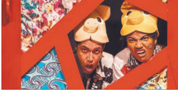
Espectáculo teatral e musical “Eleguá, Menino e Malandro”

E para as crianças o Sesc Santana apresenta “O Touro Ferdinand”, no sábado (25) de agosto, às 14 horas, Ferdinand é um touro gigante com um grande coração. Depois de ser confundido com um animal perigoso, ele é capturado e arrancado de sua casa. Determinado a voltar para sua família, ele se une a uma equipe desajustada nessa grande aventura. Indicado ao Oscar de Melhor Animação. Ingressos disponíveis nas Bilheteiras das unidades do Sesc no Estado de São Paulo, evento gratuito.