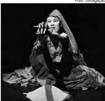
Mestra da arte butoh Yumiko Yoshioka

O PROJETO TEATRO Uma Pátria Habitável traz a japonesa mestra da arte butoh Yumiko Yoshioka e o espanhol Miguel Camarero para ministrar oficinas, preparar espetáculos e interpretar em eventos de 18 a 29 de setembro, na Refinaria Teatral, que fica na Zona Norte (Rua João de Laet, 1.507 - Tel.: 3624-9301, Vila Aurora).