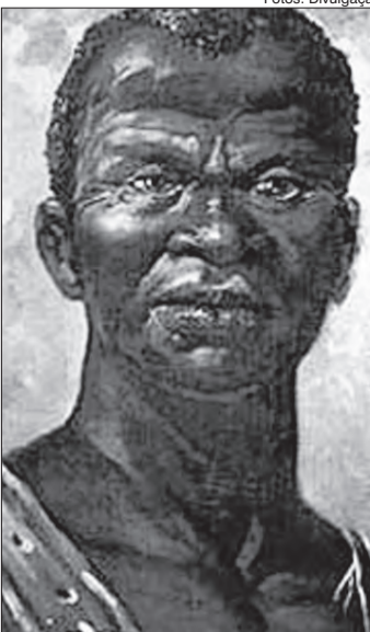
Zumbi dos Palmares morreu no dia 20 de novembro de 1695

e de luta por direitos violados. Zumbi foi morto por ser traído por Antônio Soares, um de seus capitães. A localização do quilombo ficava onde é hoje o estado de Alagoas, na Serra da Barriga, que fica a cerca de 76,4 km do município de União dos Palmares, situado a 9 quilômetros de Maceió, capital do estado de Alagoas, lá viveram mais de 20 mil pessoas entre 1597 a 1695. A Lei também traz a inclusão da temática "História e Cultura Afro-Brasileira" no currículo escolar, resgatando a contribuição do povo negro nas áreas: social, econômica e política pertinente à História do Brasil. O Dia da