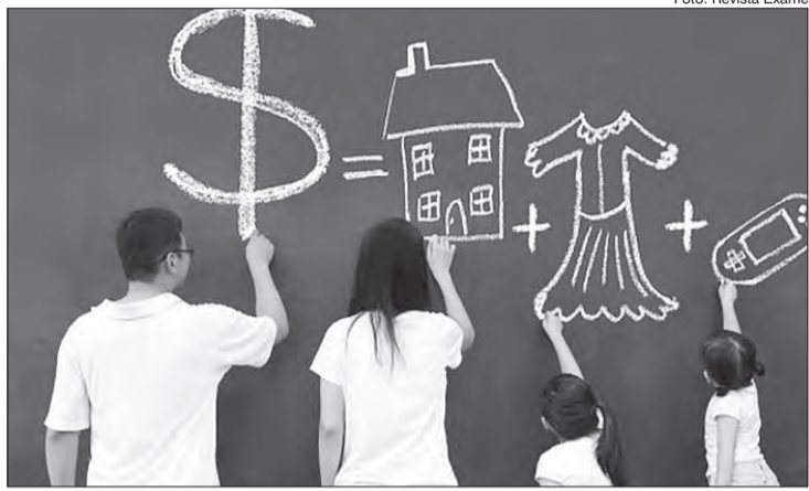
Educação financeira impacta na vida de toda família

Qual o impacto para as famílias da escola implantar educação financeira para os filhos? Pode parecer que não existe relação direta entre as finanças familiares e a educação financeira aprendida nas escolas pelos filhos, mas em pesquisa realizada pela Associação Brasileira de Educação Financeira (ABEFIN) em parceria com Instituto Axxus e Unicamp, mostra que essa relação é altamente benéfica, impactando em toda a finança familiar.