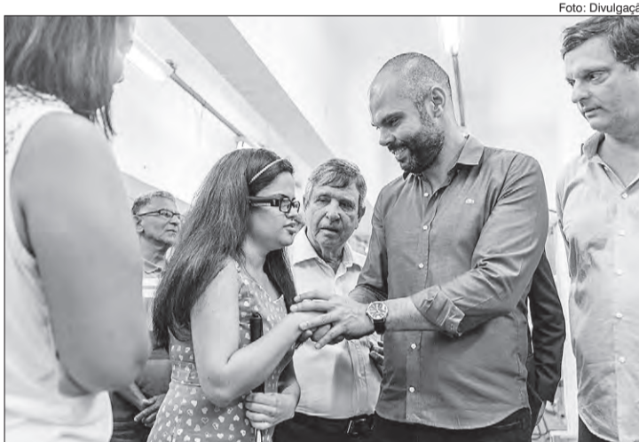
Prefeito Bruno Covas entrega um par de Óculos-Scanner

Na última terça-feira (13) de novembro, o prefeito Bruno Covas entregou um par de Óculos-Scanner para a Biblioteca Jayme Cortez do Centro Cultural da Juventude, na Zona Norte da capital. O aparelho escaneia e transforma, instantaneamente, o conteúdo de textos de jornais, livros e revistas em áudio para pessoas com deficiência visual, déficit de atenção e dislexia.