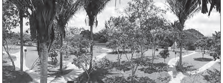
Parque Memorial Zumbi dos Palmares em Alagoas-BR

Consciência Negra surgiu para lembrar o quanto os negros sofreram, o quanto lutaram e conquistaram desde a colonização do Brasil, mas também serve para homenagear aqueles que lutaram pelos direitos da raça e seus principais feitos.