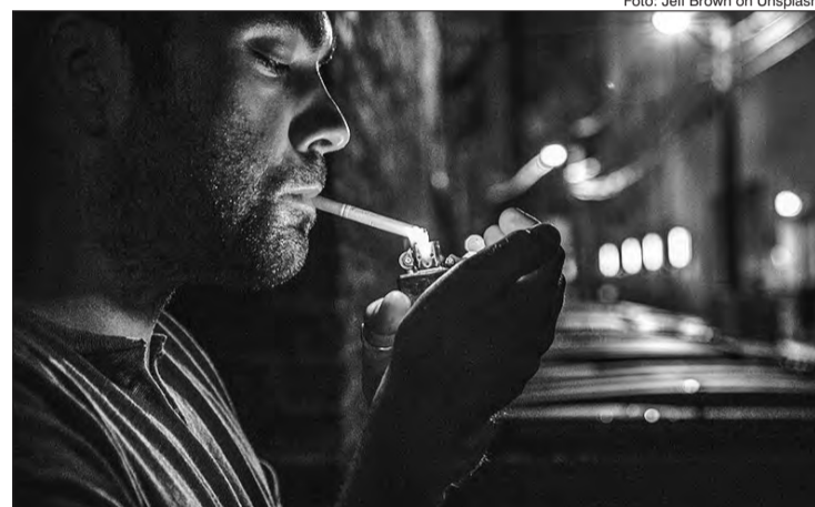
82% dos atuais fumantes optariam por uma solução menos danosa do que o cigarro

O diretor da Philip Morris reconhece que a indústria tem um