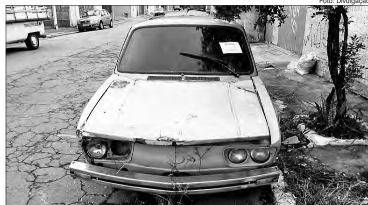
As carcaças são recolhidas na necessidade de levantamento dos dados do proprietário

O trabalho da Fiscalização da Prefeitura Regional Jaçanã/Tremembé com relação aos veículos abandonados, 99% das demandas são através do 156. A primeira vitória é para constatar se, efetivamente o veículo está no local. Uma vez confirmado, o veículo é adesivado, com prazo de cinco dias para a retirada, se não estiver no local, a demanda é baixada do sistema.