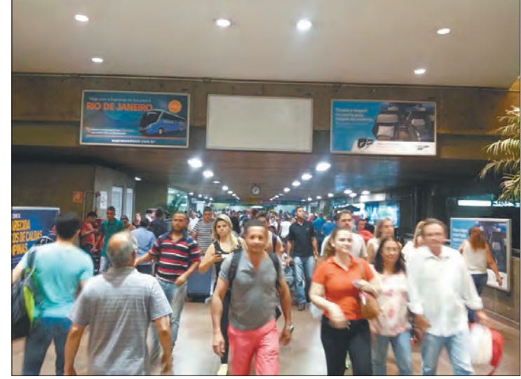
Terminal Rodoviário do Tietê recebe operação especial

pela grande procura, é importante que o passageiro compre as passagens da ida e da volta com antecedência. Dependendo do destino, a aquisição pode ser feita pelo site ( www.socicam.com.br ) ou diretamente com a viação escolhida;