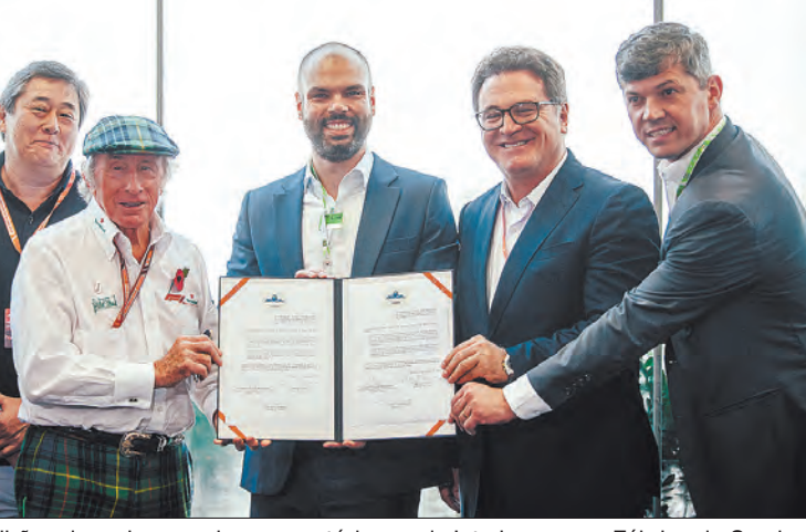
R$ 83 milhões de reais para obras no autódromo de Interlagos e na Fábrica do Samba

A estrutura do local que irá abrigar as escolas de samba do Grupo Especial de São