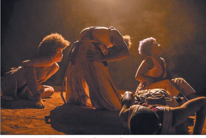
Orikis aos Mitos Pessoais Desaparecidos

Na terça-feira 20 de novembro, às 18 horas, "Anonimato - Orikis Mitos Pessoais Desaparecidos" com a Cia. Treme Terra, espetáculo de dança negra que revela situações do cotidiano brasileiro, bem como, aspectos ligados ao soterramento e aniquilamento das memórias negras no seio de uma sociedade eurocentrada, marcada por um histórico secular racista e colonialista, que violenta pessoas e tradições culturais de matrizes africanas, indígenas e periféricas. O ingresso custa R$ 20.