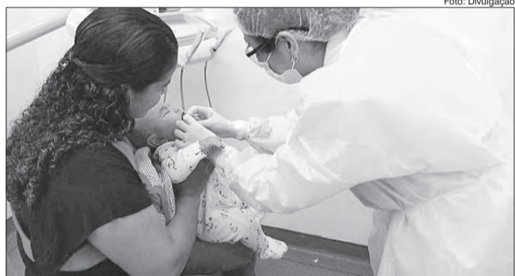
Grupo Bebê Feliz acontece na terceira segunda-feira do mês (Disponível apenas para moradores do território cadastrados na unidade)

"Orientamos que até os dois anos de idade, que é quando começam a nascer os primeiros dentes de leite, seja realizada a higiene com uma fraldinha úmida enrolada no dedo, para retirar os