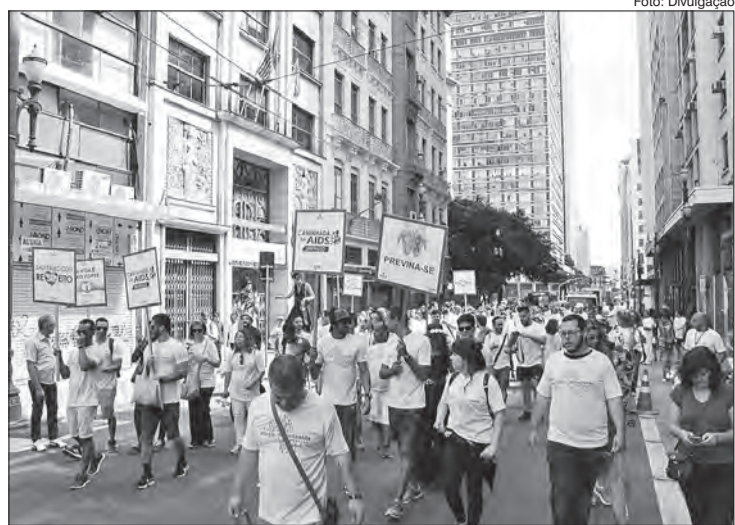
Caminhada em 2017

No dia 5 de junho de 2018, a Prefeitura de São Paulo ratificou o seu compromisso com a Declaração de Paris, assinada pelo município em 2015. O prefeito Bruno Covas renovou a