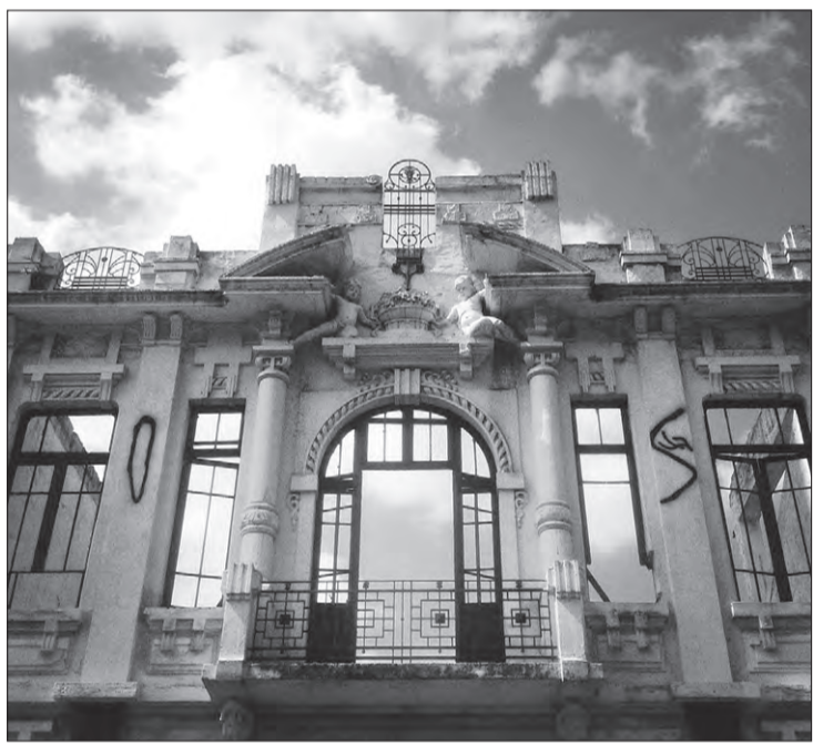
"Labirinto em Mim", do fotógrafo Marcello Vitorino

tindo que o meio urbano crie-se seus próprios caminhos.