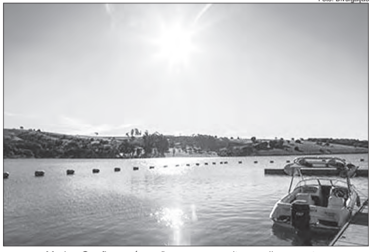
Marina Confiança é opção para aproveitar os dias quentes

O interior de São Paulo é uma das boas alternativas de turismo para aproveitar o verão. Uma das boas opções está em Bragança Paulista a 80 km da capital paulista. Cercada pela represa Jaguari-Jacareí, a Marina Confiança, na cidade do interior paulista, é o lugar ideal para passar as férias de janeiro ou aproveitar os feriados praticando atividades náuticas e se deliciando nas piscinas e na represa.