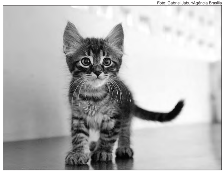
Evento de adoção neste sábado (9) de fevereiro

O evento acontecerá aos sábados, das 13 às 19 horas, e para adotar um dos animais é necessário ser maior de 18 anos, portar o documento de identidade, passar na entrevista da ONG, ler e assinar o termo de adoção. Todos os animais disponíveis para adoção estão castrados, vacinados e vermifugados. Esse projeto faz parte das ações de incentivo a adoção da Cobasi que realiza eventos em parceria com instituições de proteção animal em diferentes cidades do Brasil.