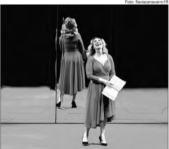
A peça “Eça do Casamento”

caminhos desejados, pois desenvolve a capacidade de concentração no foco, diminui os níveis de cortisol (hormônio do estresse), ensina a administrar os pensamentos, aumenta a serotonina (hormônio do bem-estar), e ajuda a compreender o valor real e útil de 15 minutos da prática. Evento gratuito, classificação livre sem retirada de ingressos.