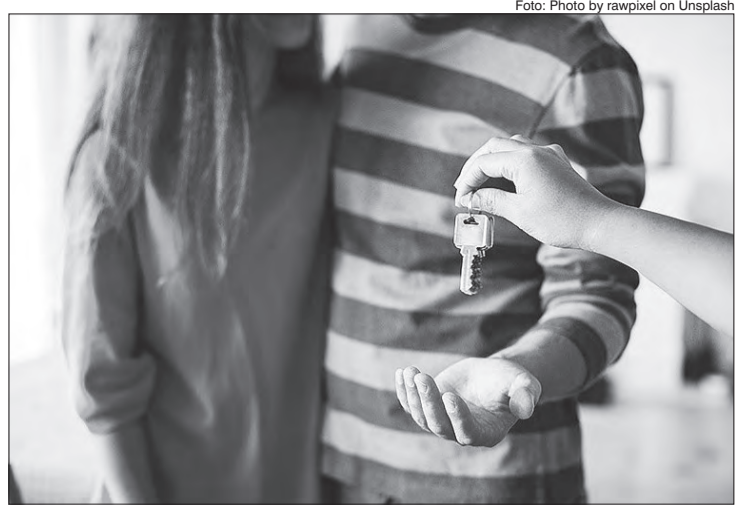
Comprar ou alugar, o que é melhor?

É importante destacar que usei índices de correção do aluguel e valorização de imóveis