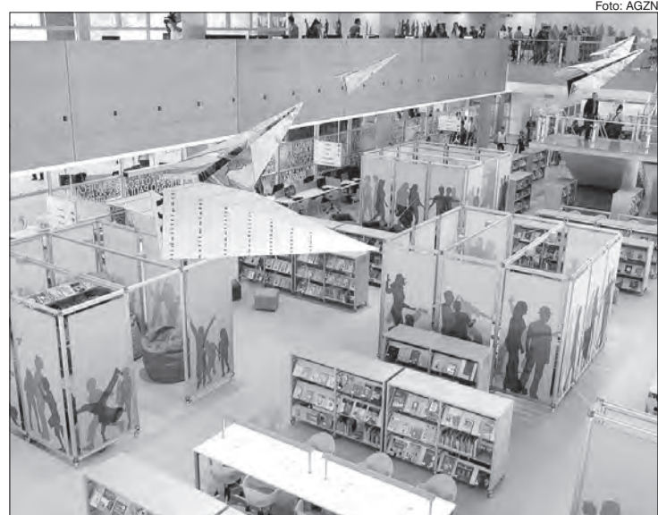
Biblioteca de São Paulo tem muitas opções em sua programação de março

11 às 13h - Jogos para Todos! - Programa permanente. Oficina de Xadrez: Os participantes aprendem as regras, os movimentos das peças e algumas táticas do Xadrez, além de disputar partidas. Pessoas com deficiência visual dispõem de tabuleiros adaptados. Vagas limitadas, preenchidas por ordem de chegada.