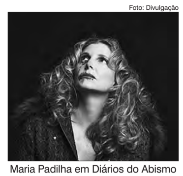
Maria Padilha em Diários do Abismo