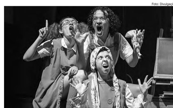
Cena de Hoje o Escuro vai Atrasar para que Possamos Conversar