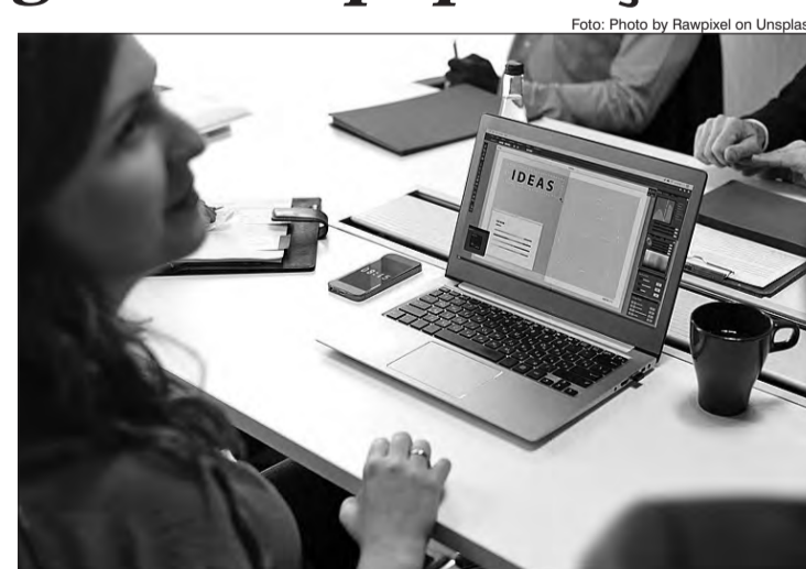
Sem perspectiva, muitos jovens tentam conseguir sucesso profissional no exterior. O principal destino de imigração ainda são os Estados Unidos

Entre 100 jovens paulistanos, 28 estão desempregados - considerando esse percentual, são 411.473 moradores da capital paulista na faixa de 16 a 24 anos que estão sem trabalho. A taxa entre os jovens é superior à da população em geral - toda a população, economicamente ativa - que corresponde a 15% no município, o equivalente a 1.469.545 pessoas desempregadas. Os dados são da pesquisa Trabalho e Renda, divulgados na última terça (19) pela Rede Nossa São Paulo (RNSP) e pelo Ibope Inteligência. O desemprego, a falta de perspectiva profissional e a atual situação econômica são alguns dos fatores declarados como incentivo para que mais jovens tentem a vida no exterior. O Brasil está entre as 10 nações onde as pessoas mais jovens saem do país. Em 2011, a Receita Federal registrou a saída definitiva de 8.170 pessoas. Em 2017, pelo menos 21.701 saídas definitivas foram registradas - aumento de 165%. Cerca de 3 milhões de brasileiros estão vivendo em outros lugares do mundo, temporariamente para trabalhar ou estudar, segundo estimativas feitas pelo Itamaraty. A expectativa é que o número seja ainda maior, já