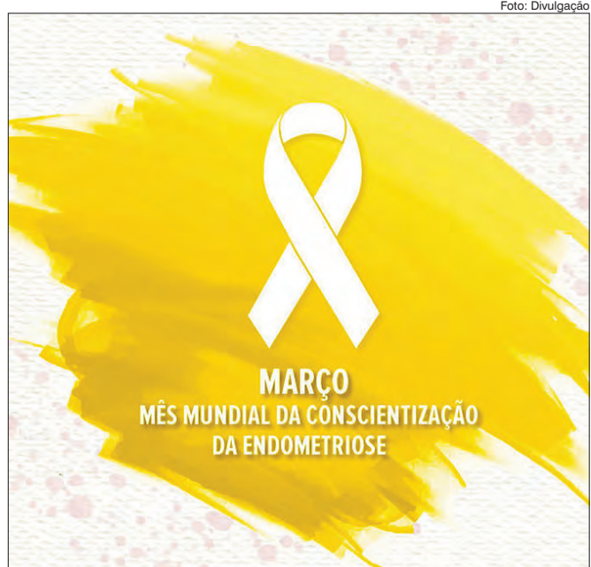
No mês de março comemora-se o Dia Internacional da Mulher e também é o Mês de Conscientização da Endometriose

No mês de março, além de ser comemorado o Dia Internacional da Mulher também é o Mês de Conscientização da Endometriose. Chamamos a atenção para os cuidados com a saúde da mulher, em especial aquelas que estão na adolescência e início da vida adulta. Durante esse período, meninas e mulheres enfrentam diversas mudanças no corpo e personalidade, o que pode mascarar os sintomas de uma velha conhecida dos ginecologistas, a endometriose.