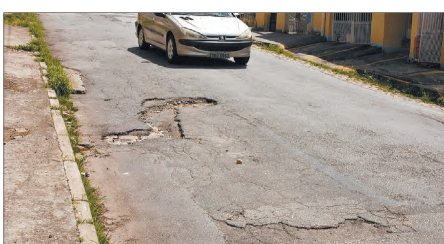
Motoristas são surpreendidos com buracos na Avenida Daniel Maletini, altura do número 708

Na Rua Camaragá, pontos de mato alto e lixo chamam a atenção de quem passa. Já na Avenida Daniel Maletini, altura do nº 708 e na Rua Altinópolis, altura do nº 420, buracos na pista surpreendem os motoristas. O mesmo acontece na Rua Capitão Alberto Mendes Junior, altura do nº 50. Já na região do Carandiru, a Praça Orlando Silva também tem mato alto. Na altura do nº 400 da Avenida Luiz Dumont Villares, a extensa área verde também impressiona pela grande quantidade de mato e lixo, principalmente caixões e cobertores deixados ali, provavelmente por pessoas em situação de rua.