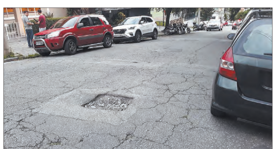
Rua Capitão Alberto Mendes Junior nº 50