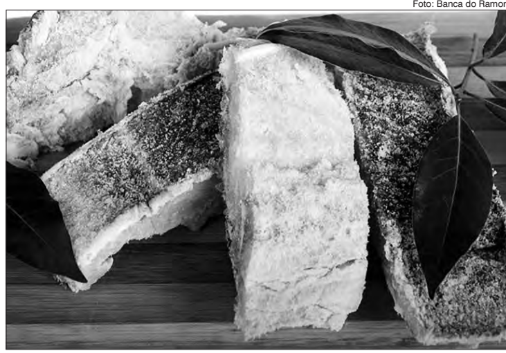
Além de saudável, o bacalhau permite uma variedade de pratos

O bacalhau tem várias possibilidades de receitas, e possui muitos benefícios para a saúde. Tendo em vista o alto valor nutritivo, é um peixe com baixo nível de colesterol e rico em ferro, magnésio e fósforo, além de vitaminas A, E e D. Para escolher