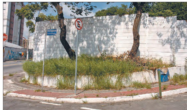
Esquina do cemitério cheia de mato

Os estudos recebidos pelos dois procedimentos estão em análise técnica para futura elaboração de edital de licitação. A concessão dos cemitérios, do crematório municipal e dos serviços funerários ainda precisa de autorização legislativa e o Projeto de Lei deve ser encaminhado para a Câmara Municipal.