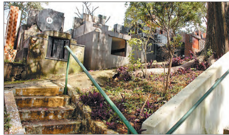
Falta de zeladoria dentro do cemitério