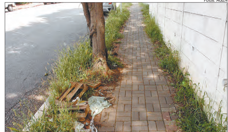
Calçada cheia de mato e com lixo