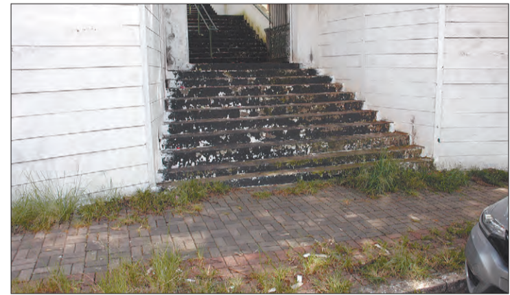
Porta de entrada do cemitério