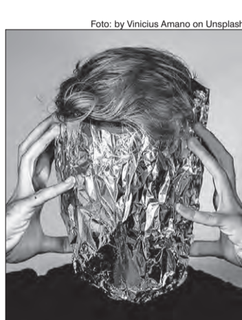
Enxaqueca não tem cura

Para BP A Baeta, neurologista da BP - A Beneficência Portuguesa de São Paulo, há muitos hábitos que contribuem para que as crises de enxaqueca sejam mais recorrentes e afetem a qualidade de vida. “Má alimentação, estresse e automedicação são alguns dos fatores relacionados à enxaqueca, embora muitas pessoas acreditem, indevidamente que alguns alimentos não recomendados nesse caso e o uso descontrolado de analgésicos possam ajudar a controlar a dor”, alerta o especialista. O médico aproveita para esclarecer alguns mitos e verdades sobre a enxaqueca: