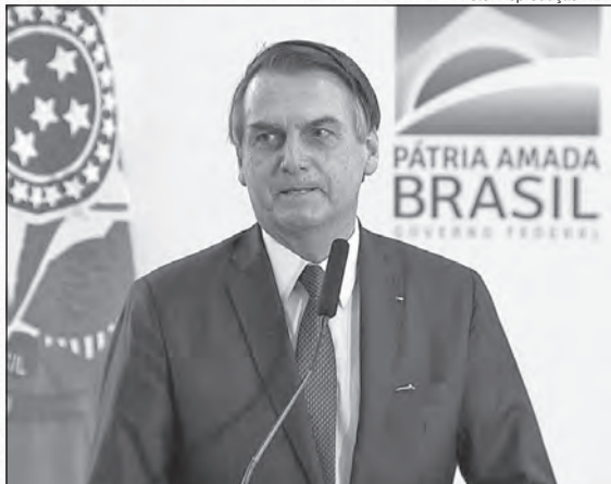
Na última quinta-feira (11), o presidente Jair Bolsonaro participou da cerimônia de celebração aos 100 primeiros dias de governo. No primeiro mês de governo, a Casa Civil

apresentou 35 metas prioritárias para os primeiros 100 dias de gestão, as metas estavam no envio do pacote anticorrupção e anticorrupção ao Congresso Nacional, à implantação do 13º salário aos beneficiários do Bolsa Família e o combate a fraudes no INSS. O presidente assinou 18 projetos e decretos relacionados às metas.