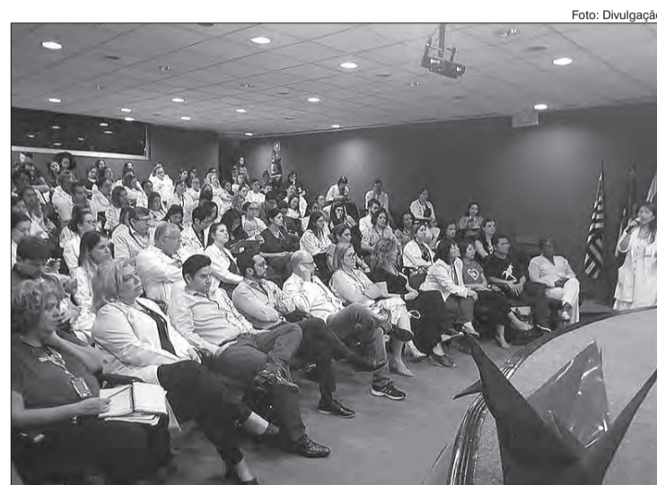
Evento no Hospital Municipal Maternidade Escola Vila Nova Cachoeirinha

Fundamentado neste conceito, o tema da Semana quer