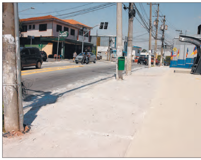
Postes no recuo do ponto de ônibus