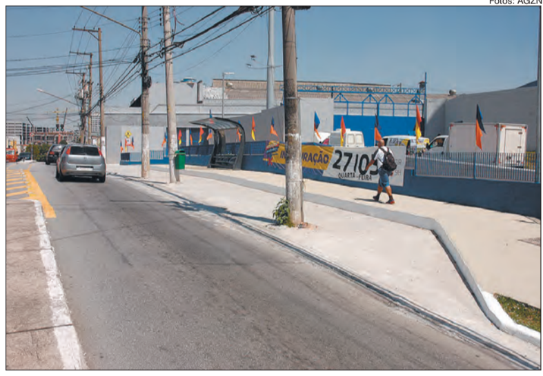
Postes no recuo do ponto de ônibus em frente ao hipermercado recém inaugurado

No dia 27 de março foi inaugurada uma loja de hipermercado na Avenida Cel. Sezefredo Fagundes, 535. Após três semanas da inauguração, um problema chama a atenção