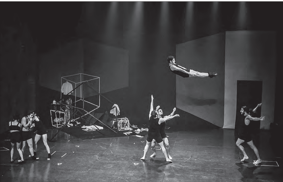
Apresentação do espetáculo circense "A Salto Alto"

O Sesc fica localizado na Avenida Luiz Dumont Villares, 579 - Jd. São Paulo. Para informações sobre essas e outras programações, ligue 0800-118220 ou acesse o site do Sesc: www.seccsp.org.br