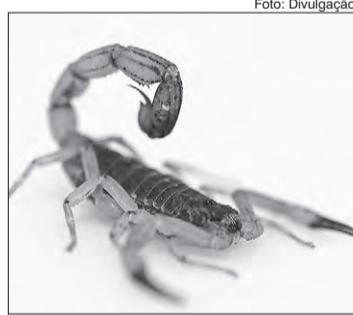
Cerca de 3.000 pessoas mortas por animais peçonhentos

Caso a pessoa encontre algum animal peçonhento, o biólogo recomenda que a pessoa se afaste, não tente assustá-lo ou tocá-lo, mesmo que possa parecer estar morto, e chame as autoridades de saúde local para tomar as devidas providências. "Se acontecer de ser atacado pelo animal, procure por atendimento médico imediatamente",