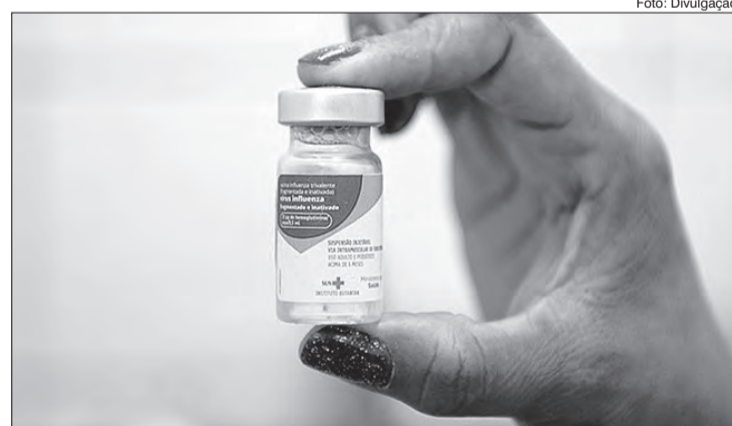
Dia D de Vacinação aconteceu no último sábado

As vacinas estão disponíveis na rede pública para os grupos prioritários: crianças de 6 meses até 6 anos incompletos, gestantes, puérperas (mães até 45 dias após o parto), indivíduos com 60 anos ou mais, professores e funcionários da educação, trabalhadores da saúde, policiais civis, militares, bombeiros e