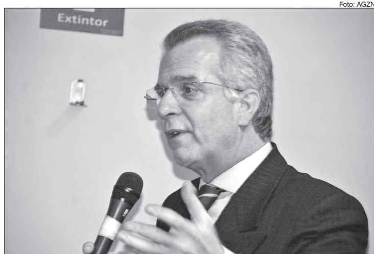
Andrea Matarazzo foi vereador, subprefeito da Sé e atuou em diversos cargos públicos

O convidado é o político-cidadão: Andrea Matarazzo, um paulistano com longo histórico de serviços prestados à causa pública. Há mais de uma década dedica-se exclusivamente à cidade de São Paulo. Foi vereador, subprefeito da Sé, secretário municipal de Serviços, secretário de Coordenação das Subprefeituras, secretário de Estado de Energia e da Cultura, ministro de Comunicação e Embaixador do Brasil na Itália. Venha debater os assuntos que nos afetam.