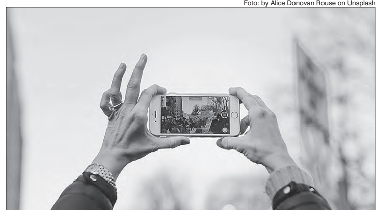
Perder o celular é muito comum em eventos cheios e abertos, saiba como proceder

O primeiro passo é tentar ligar para o celular e verificar se alguém encontrou e quer devolver. Se não der certo, o jeito é usar o sistema de rastreamento do aparelho. Para celulares com sistemas Android, basta procurar no Google por "Ache meu telefone". Para quem tem iOS, é necessário entrar em "Rastrear e encontrar um dispositivo Apple perdido" no próprio site da Apple. Se você acha que pode ter esquecido o celular no carro de um motorista que chamou por aplicativo, busque a área de ajuda no site da empresa.