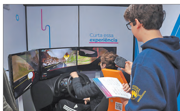
O laboratório móvel passará por escolas públicas e privadas de São Paulo

30/5 - Escola Estadual Imperatriz Leopoldina - Rua Togo, 571 - Jardim Japão