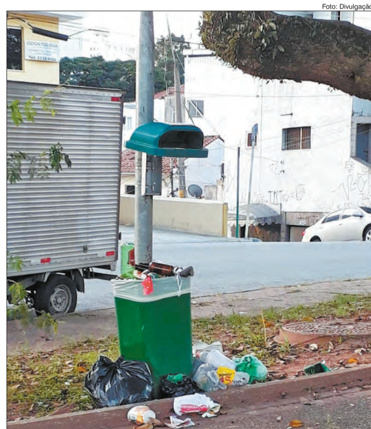
Excesso de lixo nas lixeiras da Praça Dr. Policarpo de Magalhães Viotti

Três dias depois do contato da leitora, ela nos informou que as lixeiras continuam lotadas, transbordando e quebradas.