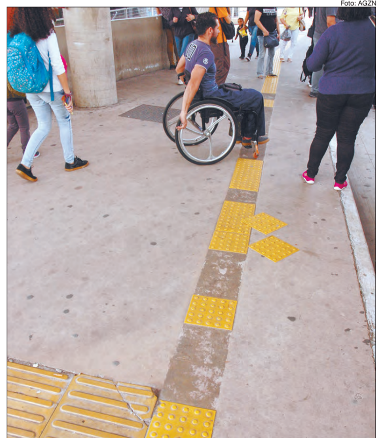
Falta manutenção na pista de acessibilidade

contato com a Subprefeitura Santana/Tucuruvi e a resposta foi que o Metrô será cobrado “A Subprefeitura Santana/Tucuruvi encaminhará o ofício ao Metrô solicitando que seja feita a devida manutenção do piso em questão”.