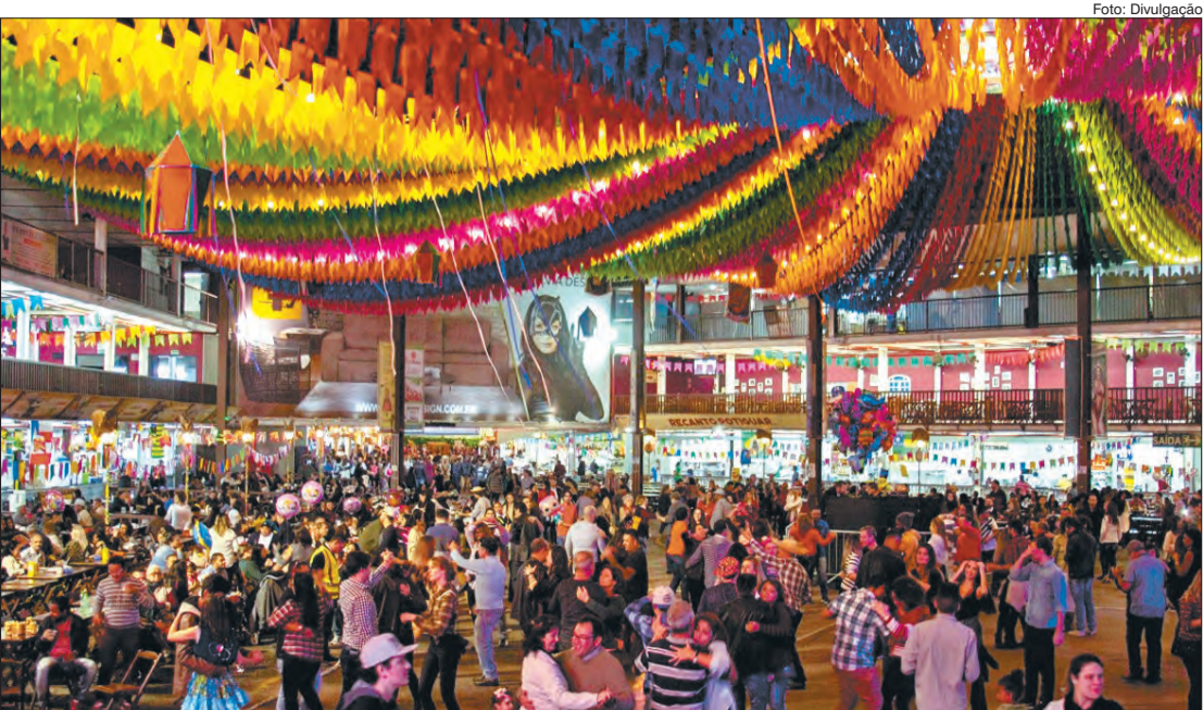
Festa Junina vai de 1º a 30 de junho com bandas de forró, comida típica e apresentações de quadrilha na programação

O Centro de Tradições Nordestinas, Zona Norte de São Paulo, se prepara para mais uma edição do São João de Nóis Tudim. O período festivo cresceu e este ano acontece de 1º a 30 de junho, sempre aos sábados e domingos, das 12 horas à 0 hora.