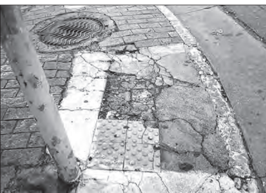
Falta de manutenção na rampa de acessibilidade