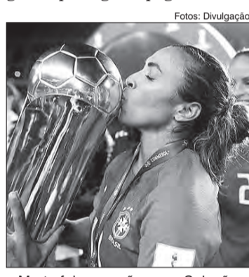
Marta foi campeã com a Seleção Feminina na Copa América e garantiu vaga para Olimpíadas de Tokyo 2020

Em agosto de 2009 jogou pelo Santos, no Brasil e conquistou o título da Libertadores e da Copa do Brasil, depois das conquistas ela saiu e em 2010 voltou ao Santos, mas teve sua segunda passagem apagada.