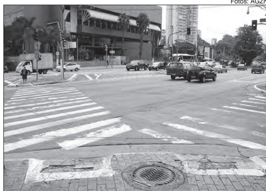
Avenida Luiz Dumont Villares, 542 x Rua Viri

Na edição de 24 de maio último, publicamos a nota com o título: "Tucuruvi: falta zeladoria na pista de acessibilidade para deficientes visuais", em matéria que abordava sobre a falta de manutenção nas faixas de acessibilidade do