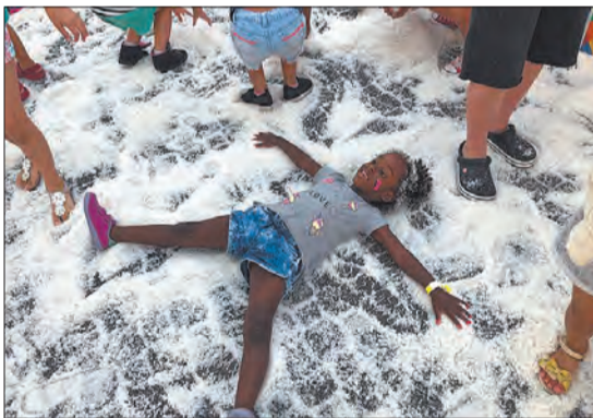
Ski Mountain Parque