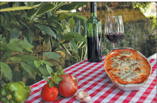
Visita à vinhedos, gastronomia italiana e até flocos de neve fazem parte da programação da cidade neste mês de julho

Ski Mountain Park - está localizada na Estrada da Serpinha s/nº - Bairro Cambará - São Roque - Preço: R$30,00 por veículo. Atracões à parte ou compra de passaportes. E-mail: skipark@skipark.com.br - Site: www.skipark.com.br - Facebook.com/skipark - Saoroque - @skimountainpark - informações: (11) 4712-3299.