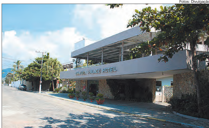
O Ubatuba Palace Hotel promove seu 4º Festival Gastronômico para aquecer a temporada de inverno na praia e para quem curte aventura o hotel tem parceria com agências que levam para trilhas, ilhas e roteiros de arte e cultura

O Ubatuba Palace hotel possui excelente infraestrutura, até mesmo para curtir os dias chuvosos. Com mais de 4500 m² de áreas sociais e de lazer possui apartamentos equipados com ar condicionado, TV com canais por assinatura, frigobar, telefone acesso à internet via wi fi em todas as dependências do hotel. Possui salão de jogos com snookers, cartas e ping pong, playground, fitness center, sauna, piscinas para adultos e