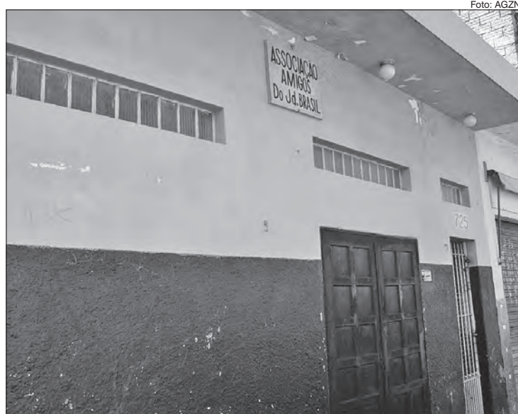
Sede da Associação Amigos do Jardim Brasil na Rua Tenente Sotomano, 725