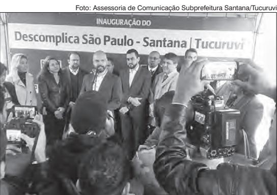
Prefeito da cidade de São Paulo, Bruno Covas, e Pedro Nepomuceno de Sousa Filho, Subprefeito de Santana/Tucuruvi (atrás do lado direito), e outras autoridades no evento de inauguração