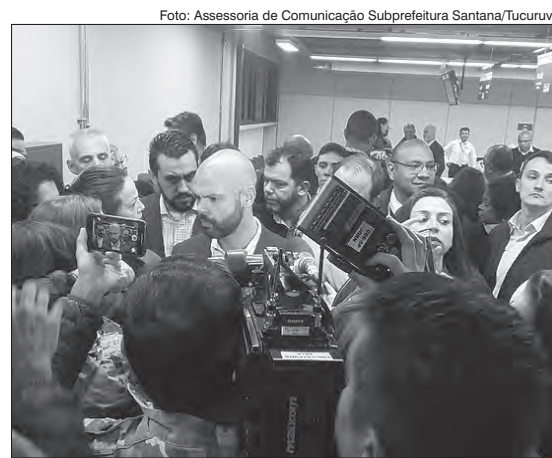
Prefeito falando sobre o Descomplica

O Poupatempo destaca que atende com hora marcada, para garantir conforto a todos. O agendamento pode ser feito no portal do Poupatempo ( www.poupatempo.sp.gov.br ), inclusive pelo celular. Outra opção é o aplicativo SP Serviços. Ou pelos telefones (11) 4135-9700 - para ligações da Capital e Grande São Paulo ou 0300 847 1998 - para os demais municípios do estado de SP. Para ligações de celulares, o número para todos os municípios do Estado de São Paulo é o (11) 4135-9700.