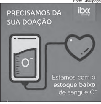
Estoque baixo de sangue O negativo

Doar sangue é um gesto importante e que pode ajudar a salvar muitas vidas. O IBCC Oncologia registra um estoque baixo do tipo O - baixo. Que tal fazer uma atitude solidária e ajudar a aumentar nosso banco de sangue? Em média mais de 10 mil consultas são realizadas na Unidade Mooca, que possui um banco de sangue autossuficiente para seus pacientes internados.