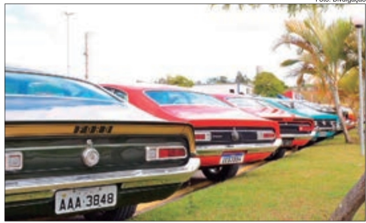
Carros antigos participarão de um evento especial para arrecadação de cestas básicas no dia 26 de setembro

A saída do comboio partirá do Pacaembu às 8 horas em direção à Arena Sambódromo. A exposição ficará disponível na área da dispersão da Arena para todos os visitantes apreciarem. Esse evento é gratuito.