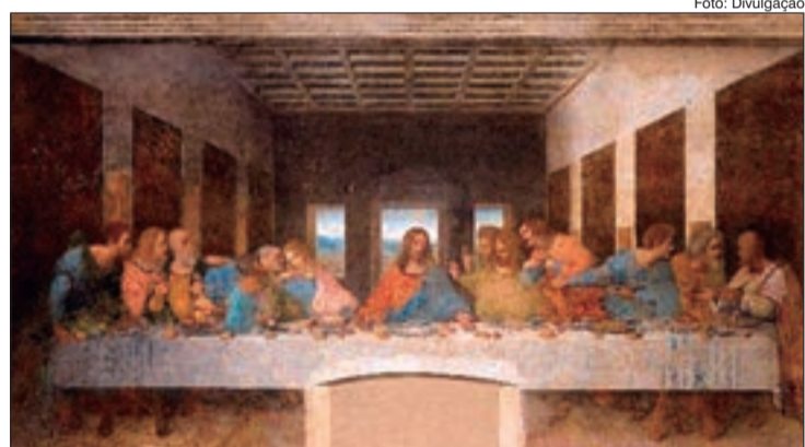
Com imersão em 360 graus, é possível acompanhar animações em alta definição, ver detalhes das máquinas desenhadas pelo artista italiano em realidade aumentada, além de áudios e vídeos exclusivos

Dividida em nove áreas temáticas, a experiência on-line apresenta máquinas e reproduções em tamanho real das obras de arte renascentista de Da Vinci, como: protótipos de seus projetos aéreos e civis, instrumentos musicais, óticos e para