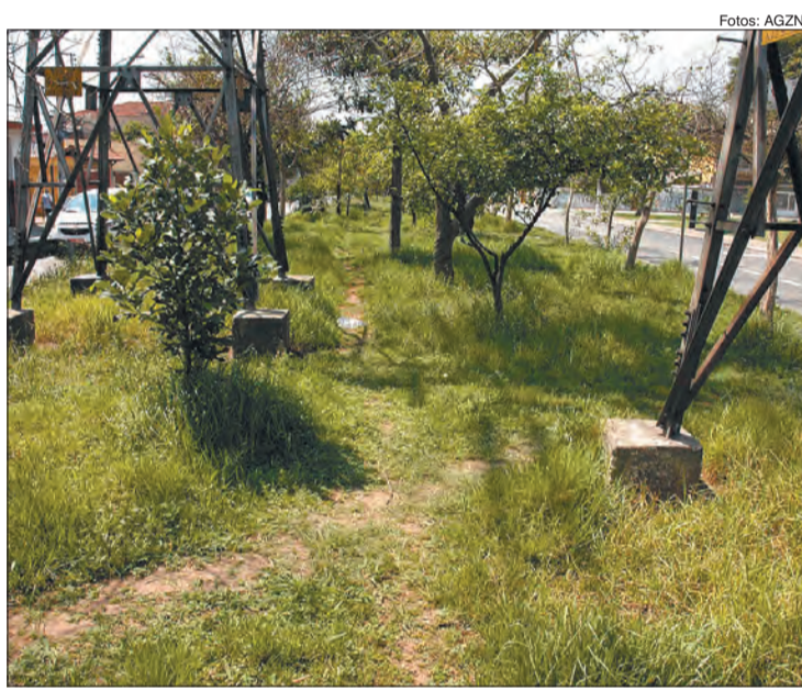
Áreas verdes de Vila Sabrina necessitam de limpeza e manutenção

O Terminal de Cargas Fernão Dias, construído em 1985,