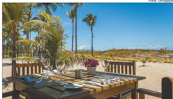
Transamerica Resort Comandatuba está localizado em uma imensa área verde de 8 milhões de metros quadrados no município de Una, no sul da Bahia a uma pequena distância do continente

(BA), o Complexo Iberostar Praia do Forte Golf & Spa Resort, é formado por dois resorts 5 estrelas: o Iberostar Bahia e o Iberostar Praia do Forte. Ambos com regime all-inclusive contam com uma extensa programação de atividades monitoradas, vários tipos de restaurantes, um sistema de reatar e um spa que oferece massagens e tratamentos.