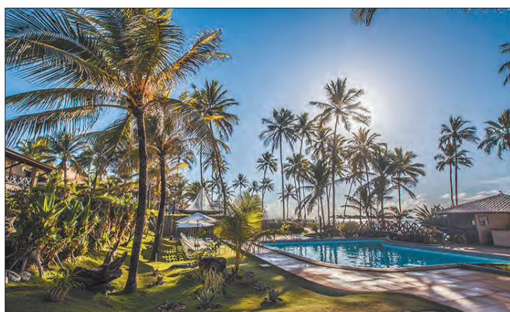
Cattusaba Resort está localizado em Salvador (BA) e é o único resort de Salvador com acesso direto à areia da praia

O Cattusaba Resort está localizado em Salvador (BA), possui uma paisagem exuberante e oferece estrutura completa