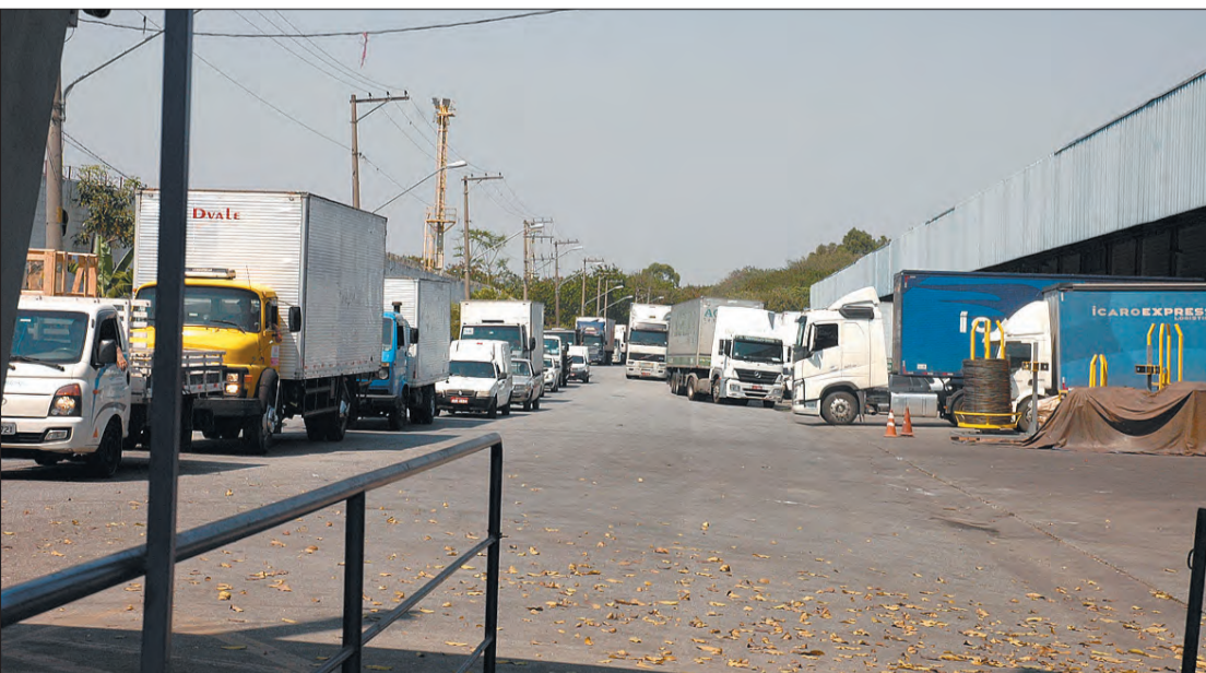
Terminal de Cargas Fernão Dias tem uma movimentação diária de, aproximadamente 5 mil caminhões