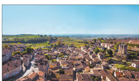
Explorar a encantadora região do sudoeste da França e ter uma imersão no mundo dos inscros