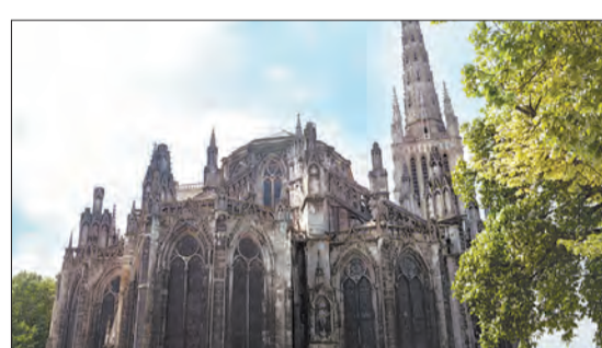
A região da lendária vinícola de Médoc, cheia de castelos com arquiteturas impressionantes

Para mais informações sobre este e outros roteiros da Uniworld, acesse www.pier1.com.br