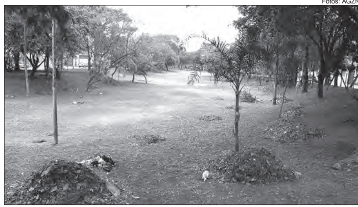
Parque Oyeno está entre as áreas verdes mais extensas do bairro