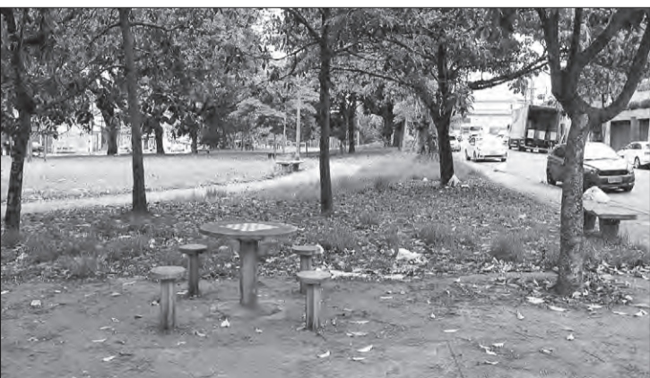
Praça Mikado é um dos locais onde o acúmulo de lixo é constante

Na área da Saúde, o bairro conta com o Hospital Vereador José Storopoli, conhecido como Vermelhinho, mas no dia a dia sua população é atendida na UBS Jardim Japão. "Há várias atividades para a terceira idade e conseguimos atender demandas dentro da necessidade de cada paciente", relata a moradora, que também atua como conselheira de saúde desta unidade.