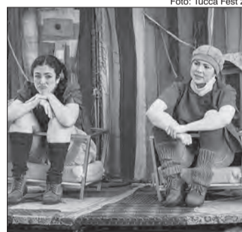
Adaptação ecológica do clássico dos Irmãos Grimm

16 às 17 horas - Hora do Conto - Papagaio de limo verde , de Silvio Romero. Com Kiara Terra. Não é necessário fazer inscrição.