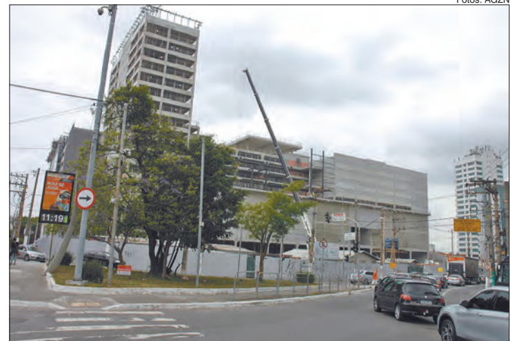
Ao comemorar 116 anos, Tucuruvi segue em crescimento

O bairro também ficou conhecido por seus antigos cinemas. Em 14 de novembro de 1925, foi inaugurado o Cine Teatro Rio Branco, na Avenida Tucuruvi. O Cine Tucuruvi foi inaugurado em 22 de fevereiro