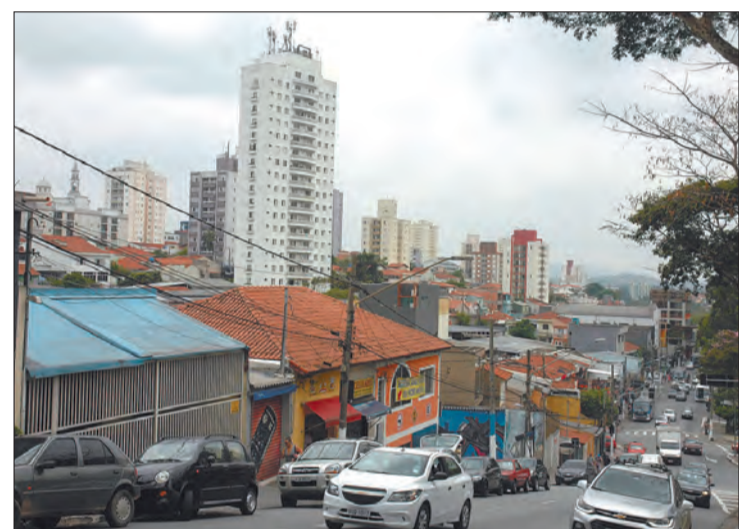
Tucuruvi apresentou intensa verticalização nas últimas décadas

Fazem parte do Distrito Tucuruvi: Jardim Barro Branco, Jardim Dona Leonor Mendes de Barros, Jardim França, Jardim Kerlakiam, Jardim Rodrigues, Vila Cachoeira, Vila Constança, Vila Mazzei, Vila Pedrosa, Vila Dom Pedro II e Vila Gustavo.