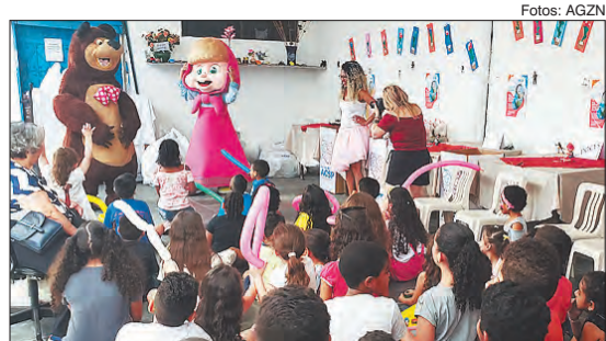
Os personagens Masha e o Urso também participaram da festa

A Campanha do Dia das Crianças foi lançada em setembro de 2019, pelo Conselho da Mulher Empreendedora da Associação Comercial de São Paulo (ACSP) e no último sábado dia 12 de outubro, aconteceu a distribuição de brinquedos e livros, realizada para as crianças da Comunidade Vila Aurora, com apoio de algumas Escolas particulares da região da Zona Norte como: Colégio Delta, Ouro Grosso, Aquarela, Êxito São Paulo e Escola Malvina Vieira. E também houve apoio de doações de doces e salgadinhos de alguns estabelecimentos comerciais da Zona Norte, para a realização do evento, empresas como: Castelo das Ilusões, Padaria Mercúrio, Padaria Mirante, Pastelaria Nova Brasileira, Malu Doces e Zazá Bolos.