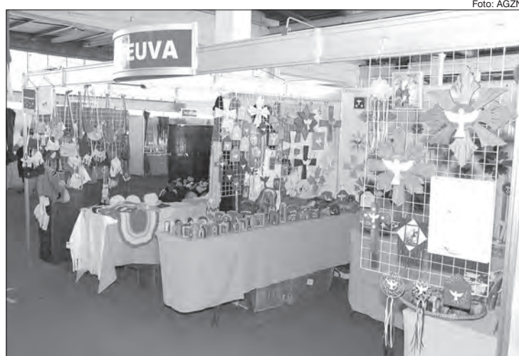
De 13 a 17 de novembro, evento gratuito traz para a capital o artesanato, a música, a dança, a gastronomia e o jeito de ser de mais de 120 cidades paulistas

Até o dia 17 de novembro, acontece o Revelando SP, das 10 às 20 horas, no Parque da Água Branca o Revelando SP, maior evento de cultura tradicional de São Paulo, realizado pela Secretaria de Cultura e Economia Criativa e produzido pela organização social Amigos da Arte, que mantém contrato de gestão com a Pasta. Mais acessível e sustentável, em seu 22º ano consecutivo, o evento reúne mais de 350 atrações de música, dança, artesanato, gastronomia e expressões culturais populares de mais de 120 cidades paulistas. É uma imersão nos sons, nas cores, nos sabores, nas artes e no jeito de ser dos brasileiros de São Paulo.