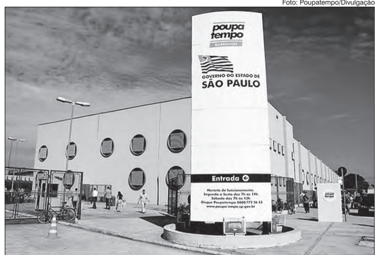
Todas as unidades fecham dias 15 e 16/11. O atendimento retorna na segunda-feira (18)

Para informações sobre endereços, horários de atendimento, órgãos e serviços disponíveis, bem como documentos necessários, prazos, taxas e agendamento eletrônico, basta acessar o portal www.poupatempo.sp.gov.br ou baixar o aplicativo SP Serviços.