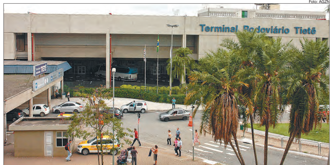
A Campanha Cartão Social Socicam já soma mais de 68 mil cartões enviados

Até o dia 21 de dezembro, de 2ª a 6ª feira, das 16 às 20 horas e aos sábados, das 10 às 14 horas, quem passar pelo Terminal Rodoviário Tietê poderá enviar cartões de Natal para amigos e entes queridos, gratuitamente. Buscando espalhar o espírito natalino por todos os cantos do Brasil, a Socicam, concessionária que administra o terminal, promove a 19ª edição do Cartão Social Socicam, que viabiliza o envio de mensagens gratuitas no período que antecede uma das celebrações mais aguardadas do ano.