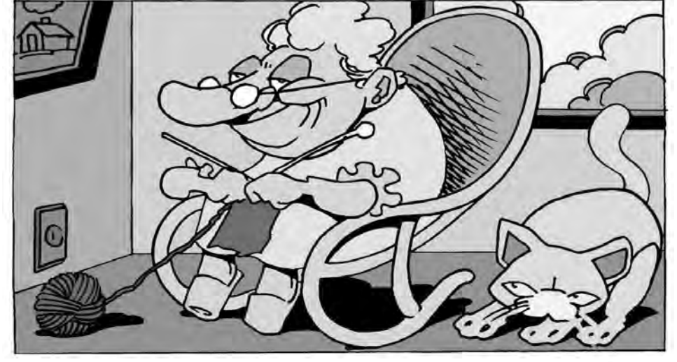
Jogo dos Sete Erros: 1-janela da casa no quadro; 2-tomada; 3-ponta da agulha; 4-chinelo esquerdo; 5-cabelo da senhora; 6-nariz do gato; 7-nuvem à direita.