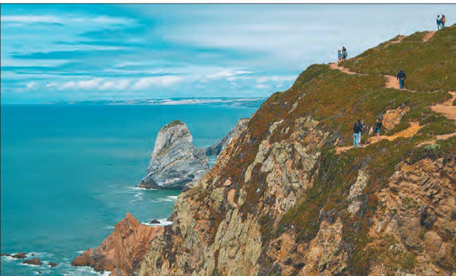
Cabo da Roca

8 - Saiba escolher o melhor modelo para sua família - Se a viagem for longa, opte pelo modelo mais completo, garantindo que não falte nada durante o trajeto. Para facilitar sua viagem as locadoras oferecem o aluguel de kits como kit cozinha (que possui pratos, copos, talheres, panelas e outros), kit pessoal (inclui lençol, cobertor, travesseiro, toalha) entre outros. Consulte-nos para os valores. Confira no nosso site alguns modelos disponíveis: https://mobility.com.br/motorhome-consulte#lista