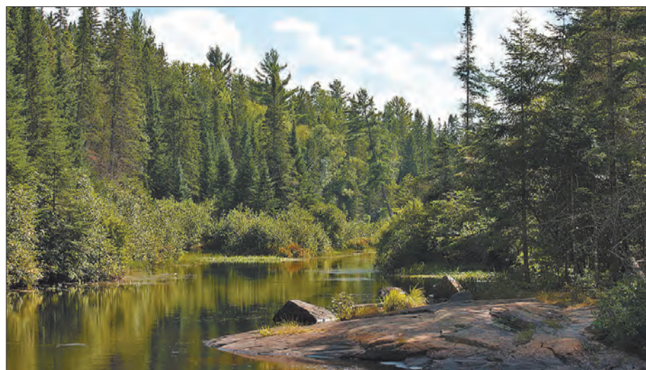
Algonquin Provincial Park

Ou seja, é uma espécie de casa móvel, motorizada.