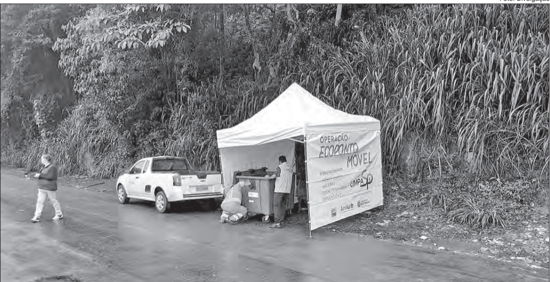
Ecoponto Móvel no Jardim Cachoeira