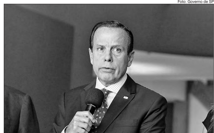
Comissão econômica anunciou R$ 500 milhões para beneficiar microempreendedores paulistas

A medida foi elaborada pela comissão de elaboração dos impactos econômicos do Coronavírus em São Paulo. O grupo é formado