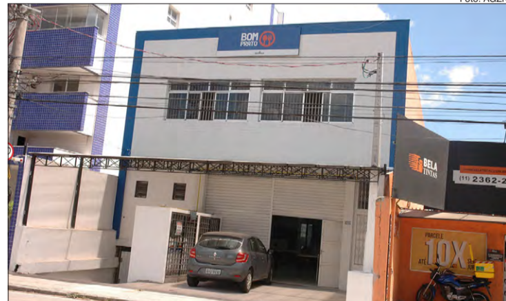
Unidade Bom Prato do Tucuruvi em novo endereço: Avenida Nova Cantareira, 2.099

A unidade Bom Prato do Tucuruvi foi inaugurada na última terça-feira (24/3), na Avenida Nova Cantareira, 2.099. Desde a última segunda-feira (23), a Secretaria de Desenvolvimento Social anunciou o Bom Prato Express, serviço que realizará distribuição de refeições prontas em embalagens descartáveis para consumo em domicílio. Atendendo ao decreto do governo do Estado e as medidas de prevenção ao COVID-19, as unidades dos restaurantes populares Bom Prato passam por mudança na operacionalização do serviço fechando temporariamente os salões de refeição.