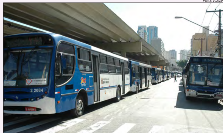
Prefeitura decide manter 55% da frota de ônibus na Capital

A SPTrans continuará monitorando diariamente a movimentação de passageiros e fará ajustes, caso necessário, para atender com conforto e segurança a população. Em razão da pandemia do coronavírus, a recomendação da Organização Mundial da Saúde (OMS) é que as pessoas evitem sair de casa. A prioridade neste momento é manter o transporte disponível àqueles que prestam