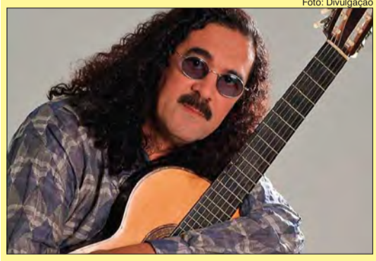
Moraes Moreira é um dos grandes nomes da música brasileira

Na última segunda-feira (13), o cantor e compositor Moraes Moreira, 72 anos, morreu em casa, no bairro da Gávea, no Rio de Janeiro. Conforme a assessoria do artista, ele morreu por volta das 6 horas depois de sofrer um infarto agudo do miocárdio. O artista lançou mais de 60 discos entre a carreira Solo, Novos Baianos, Trio Elétrico Dodô e Osmar, além da parceria com o guitarrista Pepeu Gomes.