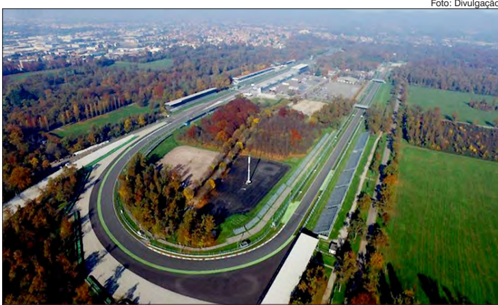
Autódromo de Monza

3. A CBF decidiu isentar todos os clubes das taxas relativas ao registro de contratos e à transferência de jogadores, pela paralisação do futebol em decorrência da pandemia do coronavírus. A validade dessa determinação, teve início na sexta-feira 3 e, é por tempo indeterminado. Estima-se que isso gere uma economia de R$ 1,3 milhão por mês aos clubes brasileiros. A medida inclui isenção de valores relativos à registro de contratos definitivos, de