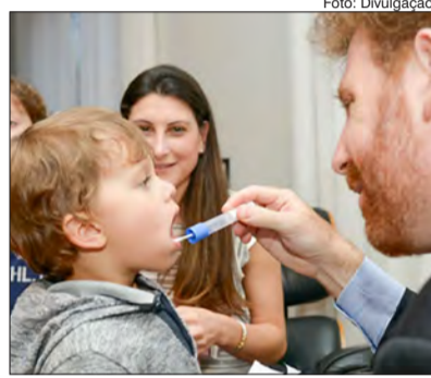
Exame detecta mais de 310 doenças genéticas ou congênitas