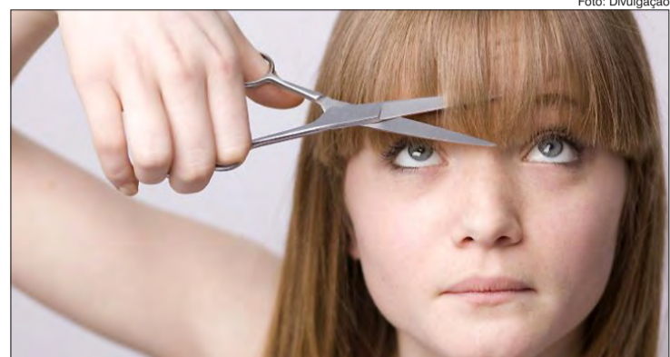
Tutoriais online apoiam quase metade das pessoas nessa atividade

E agora, com os salões de beleza fechados devido às determinações de isolamento social, mais de 50% dos entrevistados do Reino Unido, Estados Unidos, Espanha, Alemanha, Itália, França e Brasil, afirmam que esperarão a quarentena