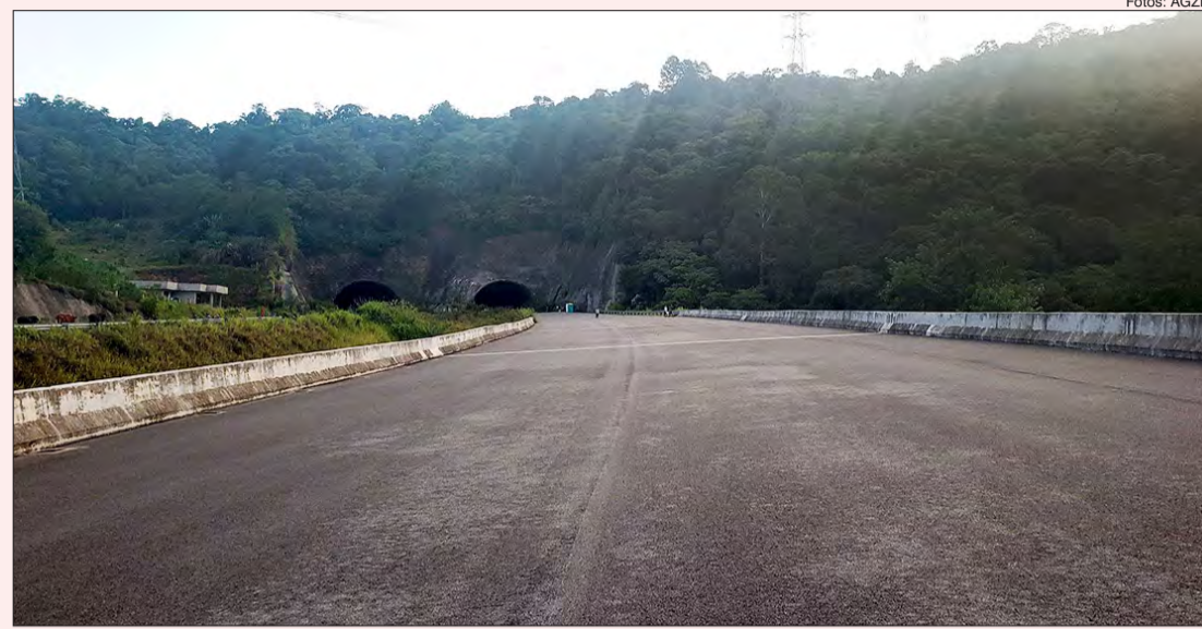
Trecho Norte do Rodoanel túnel próximo a Avenida Cel. Sezefredo Fagundes

O Trecho Norte do Rodoanel deveria ser inaugurado em 2016, mas permanece com as obras totalmente paradas, sem previsão de retomada. Dessa vez, o motivo para a falta de perspectiva é a pandemia do covid-19. Quando as obras foram iniciadas, em 2013, seu custo previsto era de R$ 4,3 bilhões. Porém, as obras já