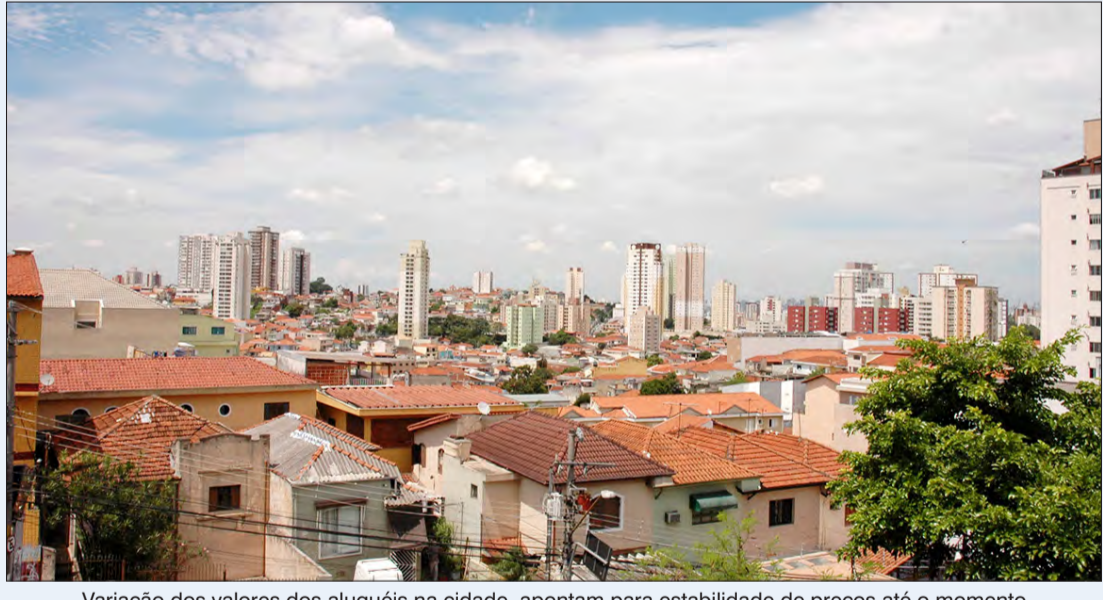
Variação dos valores dos aluguéis na cidade, apontam para estabilidade de preços até o momento