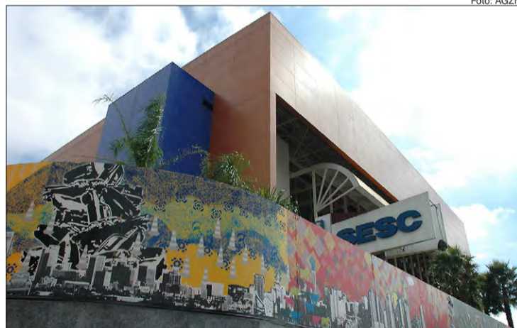
Sesc oferecem programação diferenciada

Neste período de isolamento social, o Sesc São Paulo também tem contribuído com os poderes públicos estadual e municipal no combate ao coronavírus, e entre algumas das medidas adotadas pela instituição, está a