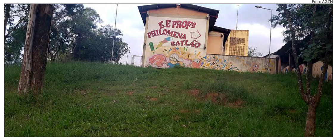
Escola Estadual Professora Philomena Baylao

O ano letivo foi retomado na última segunda-feira (27), com o ensino por meio dos aplicativos: Centro de Mídias SP (CMSP) e dos canais digitais 2.2 - TV Univesp e 2.3 - TV Educação. Os kits com materiais pedagógicos começaram a ser distribuídos.