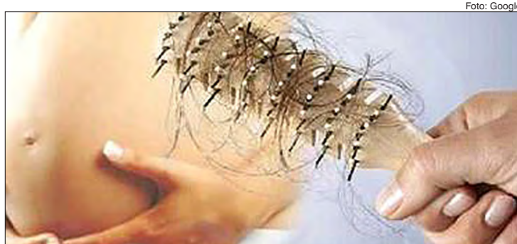
Especialista conta que, uma das soluções que vem sendo explorada pelas mulheres é o transplante capilar