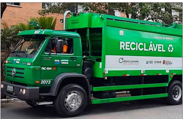
Dados do Movimento Recicla Sampa apontam aumento de mais de 280% de procura sobre o assunto e números da Prefeitura demonstram crescimento na reciclagem

Os moradores da capital paulista podem ter acesso ao dia e horário que o caminhão da coleta seletiva passa em sua rua por meio desse link no site do Recicla: https://www.reciclasampa.com.br/horarios-de-coleta ou ligue na central 156 da Prefeitura.