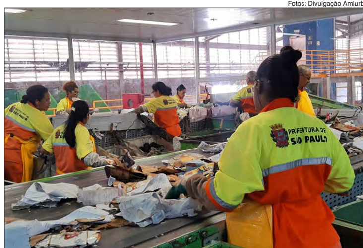
O movimento tem como objetivo ampliar a coleta seletiva na capital e conta com uma plataforma online de amplo conteúdo