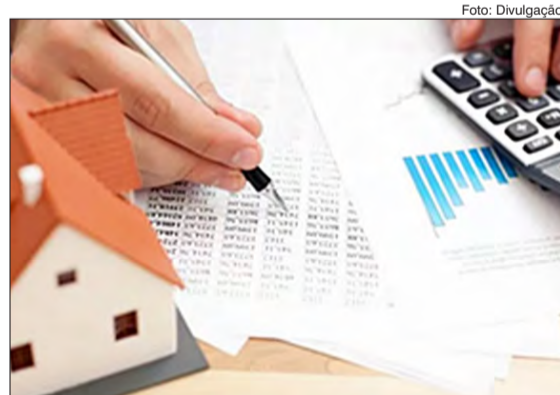
Especialista alerta sobre fatores que devem ser considerados na renegociação de financiamentos

• Procurar saber sobre juros, em alguns casos, dependendo do órgão responsável pelo financiamento, a cobrança de juros é automática, por isso é sempre bom estar em contato direto com os