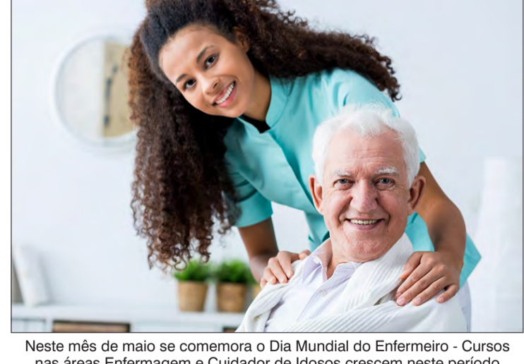
Neste mês de maio se comemora o Dia Mundial do Enfermeiro - Cursos nas áreas Enfermagem e Cuidador de Idosos crescem neste período

A cadeia de serviços voltados para pessoas acima de 60 anos só cresce. Muitos desses brasileiros querem ter tranquilidade no dia a dia, e o Cuidador de Idosos é especializado em oferecer este bem-estar e atendimento que o idoso precisa. A profissão está em crescimento exponencial, segundo o Caged (Cadastro Geral de Empregados e Desempregados), em 2014 eram 23.949 cuidadores, em 2018 o número foi para