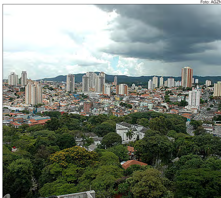
Imóveis pequenos e mais acessíveis lideram as vendas no setor

A análise por zonas da cidade demonstra que a região Sul, liderou em vendas (572 unidades), oferta (11.391 unidades), lançamentos (587 unidades) e VGV (R$ 167,1 milhões). A Zona Norte destacou-se com o maior VSO