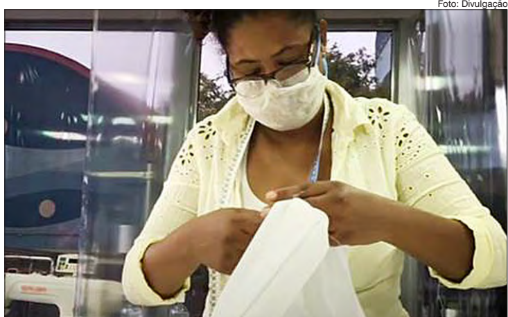
Até o momento, cerca de 120 costureiras e costureiros já entraram em atividade e produziram mais de 50 mil máscaras para doação

Nos últimos dias, entraram em atividade mais quatro carretas instaladas na Etec Carolina Carinhoso Sampaio (Jardim São Luís), Etec Cidade Tiradentes, Etec de Esportes (Parque Novo Mundo) e Etec Sapopemba. A produção teve início ainda na Etec Abdias do Nascimento (Paraisópolis), Etec Carlos de Campos (Brás), Etec Itaquera 2, Etec Rocha Mendes