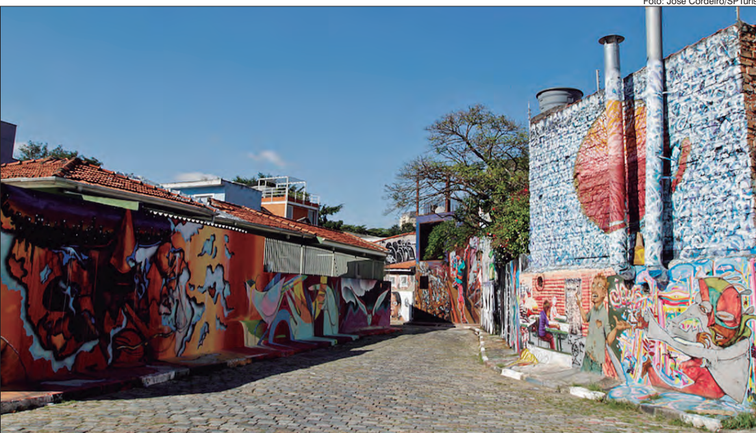
Beco do Batman, na Vila Madalena