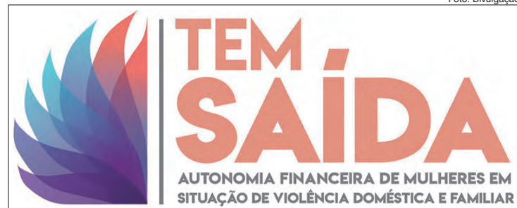
Mulheres que integram o programa Tem Saída serão beneficiadas pela iniciativa

“A regulamentação era necessária para passarmos a estruturar essa importante ação que contou com a sensibilidade do prefeito Bruno Covas, para a temática da mulher em situação de violência doméstica. A pandemia pelo coronavírus só evidenciou o drama de centenas de mulheres que ainda são obrigadas a conviver com seus agressores por falta de renda”, ressalta a secretária de