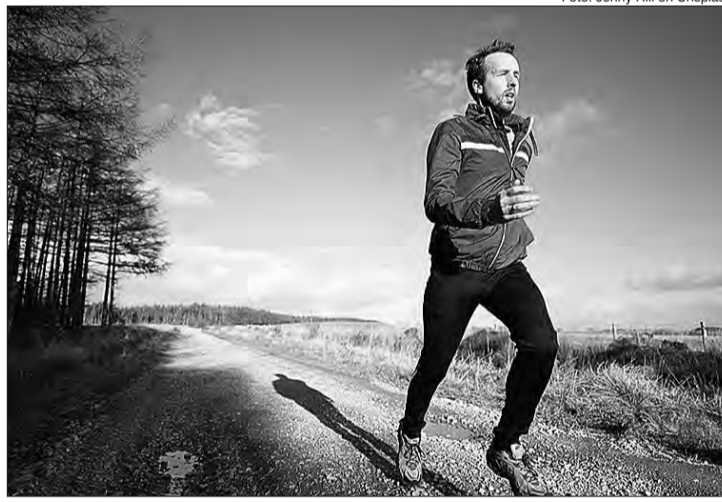
Especialista da SELFIT indica priorizar exercícios articulares e alongamentos dinâmicos

Depois de aquecer bem o corpo, o especialista da SELFIT dá dicas para quem quer começar a se mexer durante a quarentena,