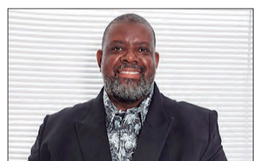
Nesta sexta-feira, 3 de julho, PÉRICLES divulgará o EP

No último domingo (28), CLARICE AMARAL, morreu aos 84 anos, ela era conhecida como uma das pioneiras na televisão. Clarice teve uma carreira de sucesso na televisão, nos primeiros 30 anos da TV brasileira. Ela começou como garota-propaganda, logo depois virou apresentadora na TV Cultura, trabalhou na Tupi, Excelsior, Gazeta e Record. Nos anos 60, comandou o "Ginkana Kibon", na Record, e ganhou o "Troféu Imprensa" em 67 como "Melhor apresentadora de TV". Ela morava na cidade de Cunha, no leste do Estado de São Paulo. A causa da morte não foi divulgada.