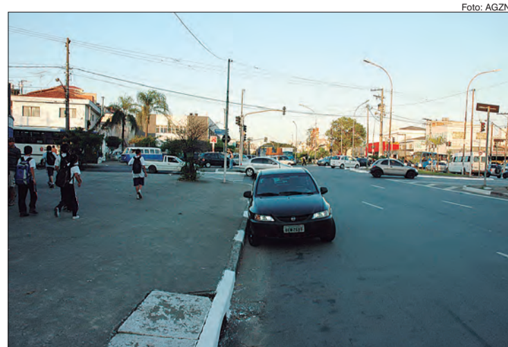
Avenida Eng. Caetano Álvares é uma das vias que tiveram os radares avaliados

A aferição no radar leva de 20 minutos, até uma hora. A