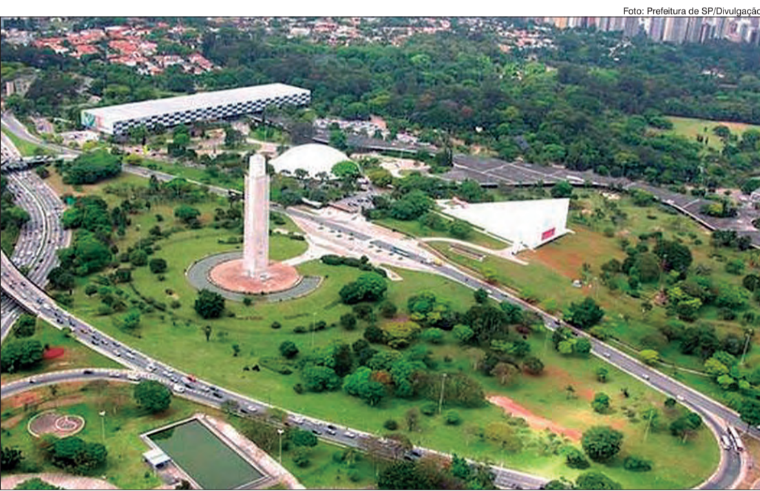
Obelisco no Parque Ibirapuera é uma das homenagens à Revolução de 1932