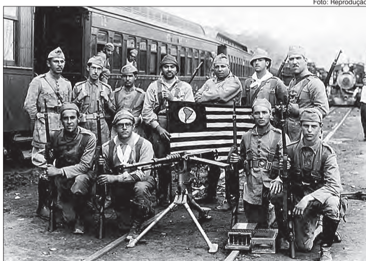
Soldados durante a Revolução de 1932

Após tomar o governo, Getúlio vetou São Paulo na indicação de presidentes (nessa época o governo do País era alternado entre pessoas de Minas Gerais e São Paulo) e irritou os membros da soberania paulista. Após o golpe, Vargas reduziu a autonomia dos Estados e apontava intermediários para governar de acordo com os seus interesses. Algumas pessoas se irritaram com as nomeações e organizaram comícios, manifestações e atos públicos. Em um desses comícios apareceram na Praça da Sé, por volta de 200 mil pessoas. Houve um conflito armado que desmontou no dia 9 de julho sob o comando de Bertolo Klinger e Isidoro Dias.