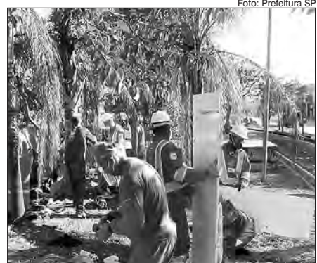
Ação foi realizada pela Prefeitura, por meio da Subprefeitura Casa Verde/Cachoeirinha