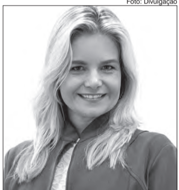
Alimentar-se bem é a melhor forma de manter a imunidade alta

Dentro do nosso sistema imunológico, temos dois órgãos que se destacam: o fígado e o intestino. Sendo assim, precisamos garantir a integridade das funções de ambos, para que o fígado, continue suprindo o nosso sistema enzimático nos processos de detoxificação e o intestino tenha sempre