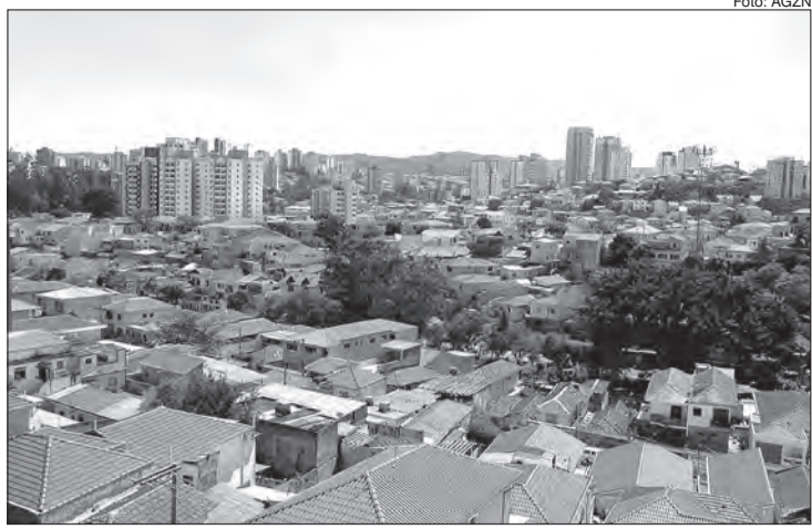
Vila Gustavo completa 104 anos de existência

Os serviços básicos de água e luz começaram a ser implantados somente em 1950. O bairro fica localizado entre