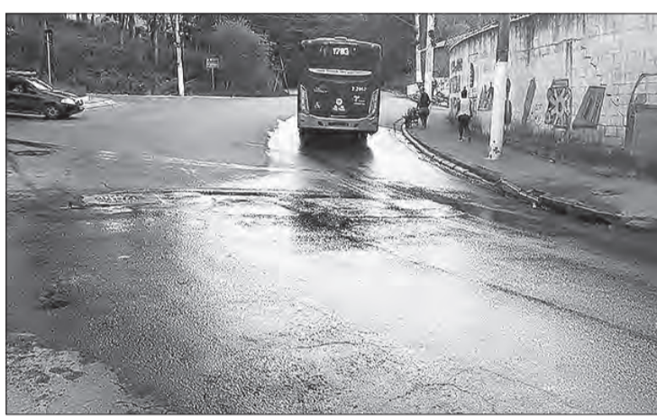
Vazamento na Avenida Cel. Sezefredo Fagundes, 14.233